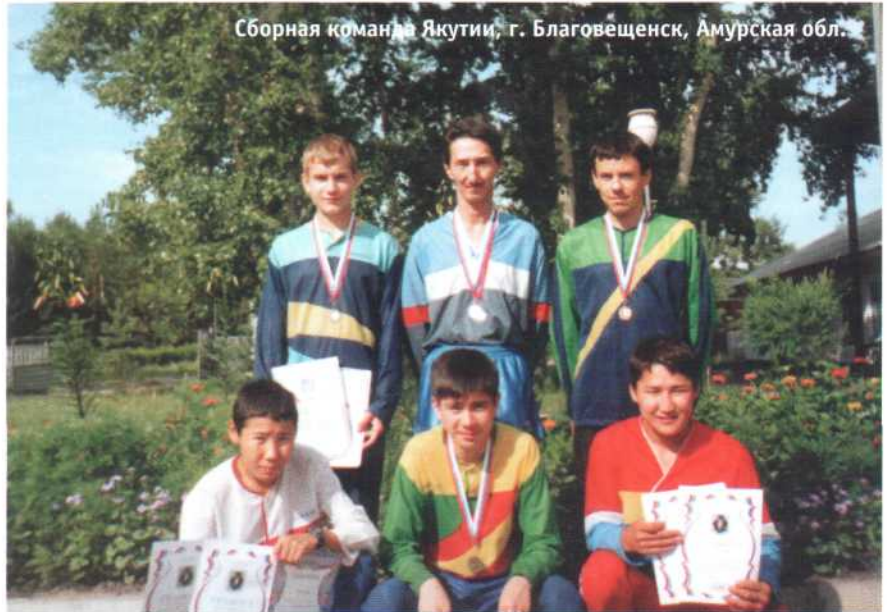
Сборная команда Якутии, г. Благовещенск, Амурская обл.

Потом мы переехали в Хабаровск на Кубок России (Азиатская часть) для взрослых и