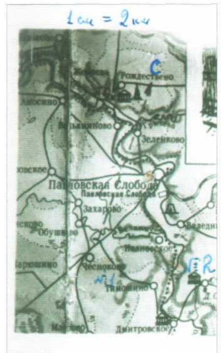
Пояснения к карте Первенства ИАЭ 4 октября 1959 года.

Но как найти счастливого обладателя такого чуда? И решится ли таковой дать сфотографировать сокровище? Пока ничего не получалось. Какой-то выход появился в конце 1958 года: в продаже появилась серия карт – 2-х-километровок на популярные у туристов районы Подмосковья. На од-