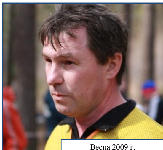
Весна 2009 г.

сложной с так называемыми «бухгалтерскими КП». За этой победой последовали и другие. В 1978-1979 гг. он неоднократно становился победителем Всероссийских зимних соревнований среди мужчин. Двукратный чемпион Кубка СССР в личном зачете и четырехкратный в эстафете. Трижды поднимался на высшую ступень пьедестала на Чемпионатах СССР и