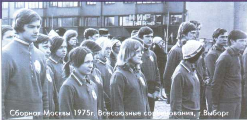
Сборная Москвы 1975г. Всесоюзные соревнования, г.Выборг

создает систему соревнований и пробивает допуск. Аналогичная ситуация продолжилась и в России. Потом к традиционному Первенству России добавляется Первенство среди ДЮСШ. Потом - Чемпионат и Первенство среди КФК. И на всех этих соревнованиях все больше и больше призовых мест захватывают ДЮСШевцы.