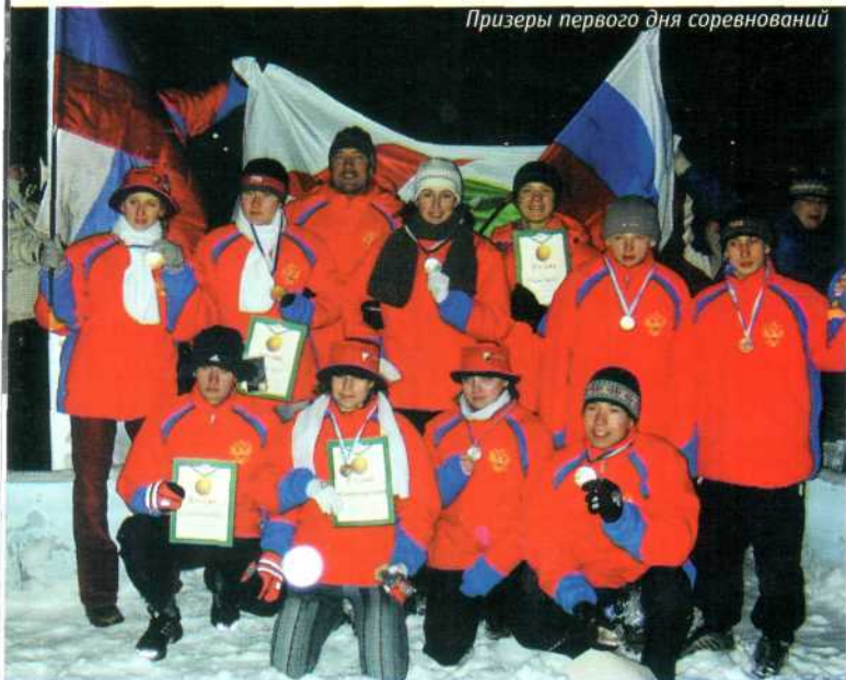
Призеры первого дня соревнований

Первенство Европы среди юношей по спортивному ориентированию на лыжах Финляндия, Вуокатти, 19-24 января 2004 г